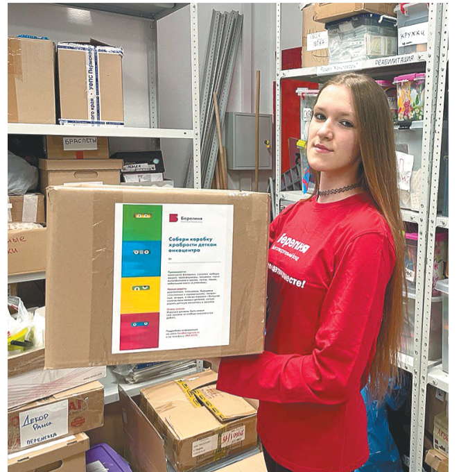
Благотворительный фонд «Берегиня»

В число тех, кто заслужил дополнительные баллы, входит волонтер благотвори-