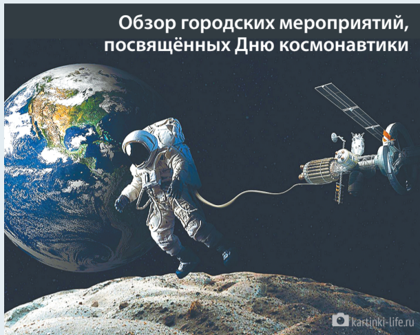
Обзор городских мероприятий, посвящённых Дню космонавтики

Центральной площадкой празднования Дня космонавтики в Перми традиционно станет Пермский планетарий. Днём на видовой площадке рядом с учреждением состоится запуск моделей ракет с воспитанниками ДЮЦ «Рифей» и наблюдение в телескоп за Солнцем. Вечером начнётся полнокупольная программа «Далёкие миры. Другая жизнь?» (12+). На следующий день планетарий начнёт работу с программы «Верхом на комете» (6+), продолжит сеансами «Пришелец из пояса астероидов» (6+), «Где живёт Земля?» (6+), «Мифы и легенды о звёздном небе» (12+) и завершит ярким шоу «Предание о звёздах» (12+). В воскресенье в планетарии пройдут четыре полнокупольных представления, в которых посетители узнают больше о звёздах, свете, эпохе динозавров и истории изучения Вселенной.