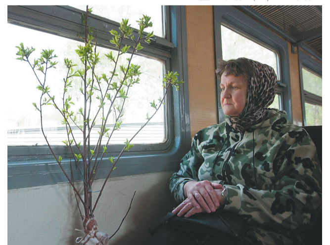
Антон Белицкий, РИА «Новости»

— №374 «Пермь — д. Ключики — п. Юго-Камский».