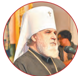
Митрополит Пермский и Кунгурский Мефодий