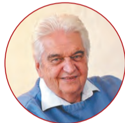
Евгений Павлович Крылатов