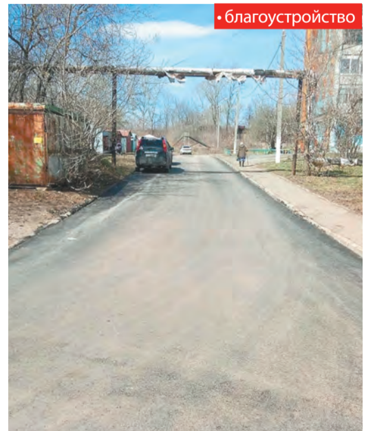
...а так она выглядит сейчас

По итогам встречи с населением территория была включена в план работ по ремонту дорог. И уже в мае подрядная организация отремонтировала асфальтобетонное покрытие внутриквартального проезда на ул. Героев Хасана.