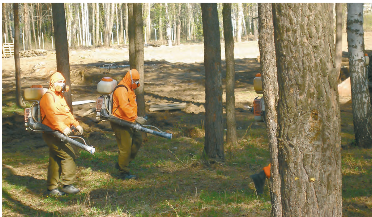
Обработка территории должна проводиться в сухую и тёплую погоду

Есть ряд требований, которые необходимо соблюдать людям, находящимся на обрабатываемой от клещей территории. Во-первых, специалисты настоятельно рекомендуют не посещать обработанную территорию в течение примерно пяти часов. Во-вторых, нельзя использовать в пищу урожай с этой территории в течение 40 дней.