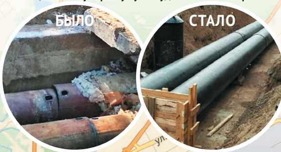
Этот коллапс за пару минут не исправишь

Сроки проведения ремонта могут быть продлены, если, копнув поглубже, энергетики обнаружат, что трубам требуется больше внимания, чем они планировали. Так бывает, когда «вскрываешь», видишь реальное состояние сетей и понимаешь, что этому отрезку нужно уделить больше времени.