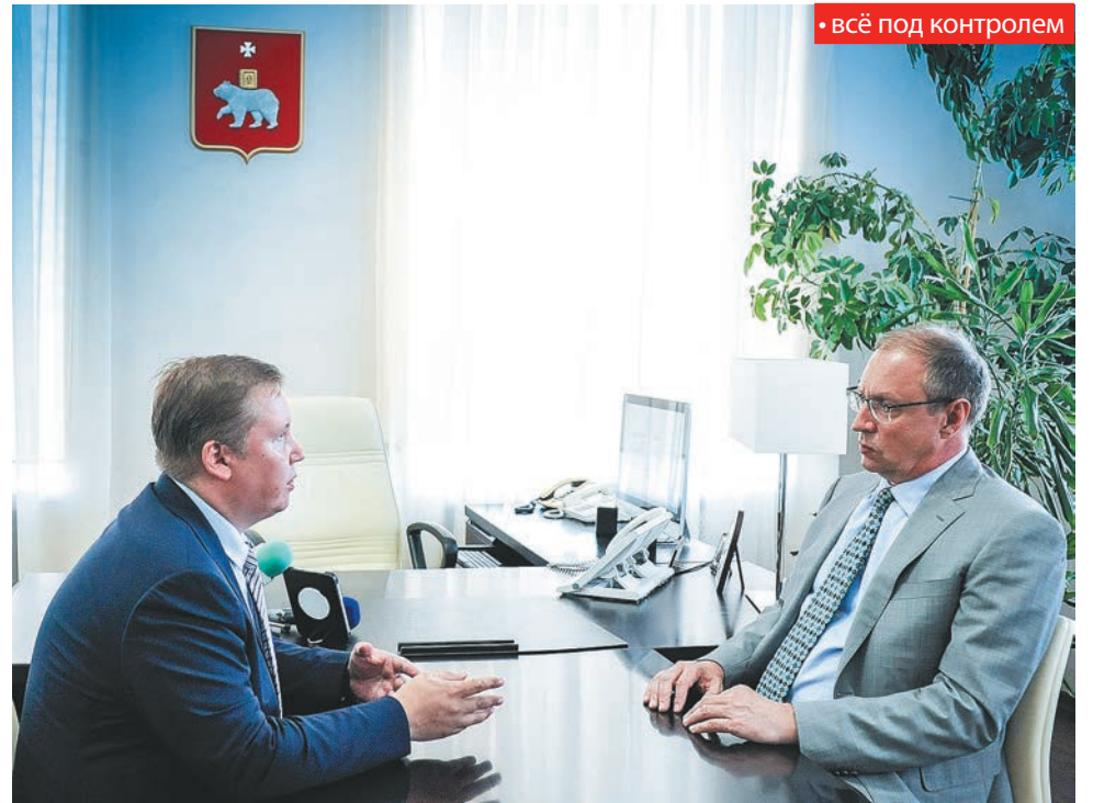
• всё под контролем

«В нашем полку прибыло — у нас сейчас порядка 70 общественных инспекторов, которые выходят на проверку ремонта дорог и дворов. Хотелось бы отметить положительную динамику: улучшилось качество работ, сокращаются сроки ремонта. На сегодня мы проверили более половины объектов, которые включены в проект