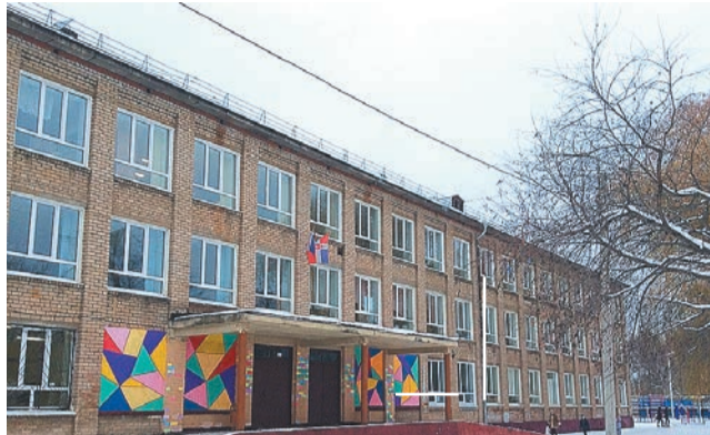
Школа №34 и школа №44 станут единым юридическим лицом

Здесь большую роль сыграла особенность этих двух учебных заведений: дети, которые посещают начальную школу до четвёртого класса, вынуждены буквально начинать всё сначала в новом коллективе, что отрицательно