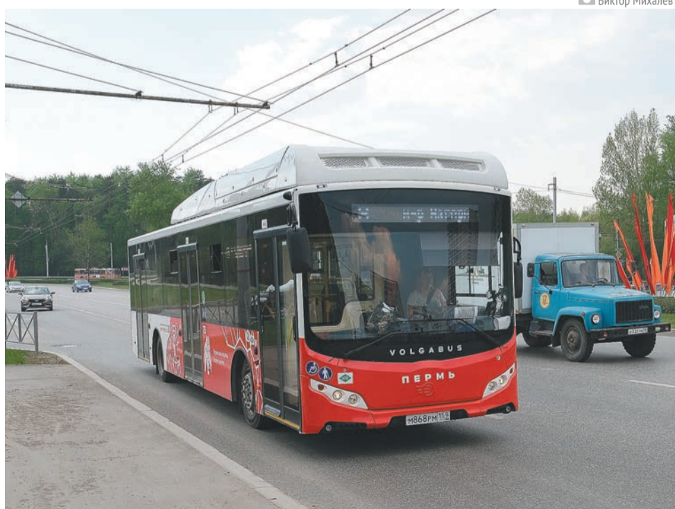
Яркими красно-белыми цветами в городском потоке транспорта выделяются новенькие автобусы

районов города. По словам Анатолия Путина, всего за время общения с населением в адрес департамента дорог и транспорта поступило более 1,5 тыс. обращений, 483 вопроса учтены полностью, 771 — частично.