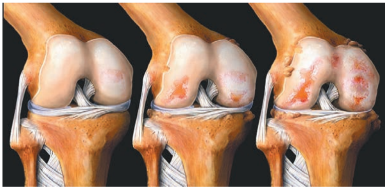
Лечение артрита четвёртой степени