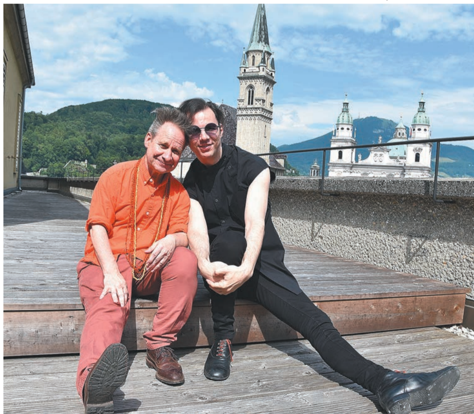
Питер Селларс и Теодор Курентзис на Зальцбургском фестивале в 2017 году