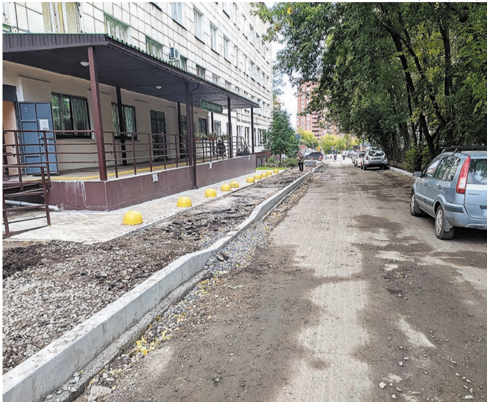
Администрация города Перми

Улицу Малую Ямскую обновят на участке от ул. 25 Октября до ул. Максима Горького. Протяжённость обновлённого участка составит 200 м. Здесь также