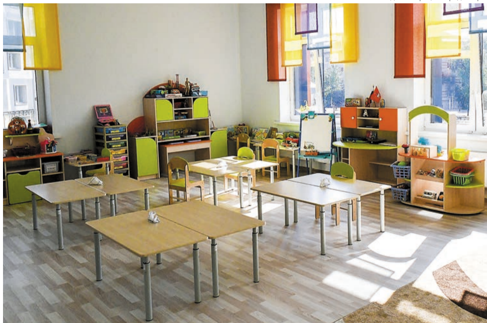
Администрация города Перми

К концу недели отоплением должны быть обеспечены все жилые дома города. По поручению главы Перми руководители районных администраций совместно с прокурорами районов при необходимости будут неза-