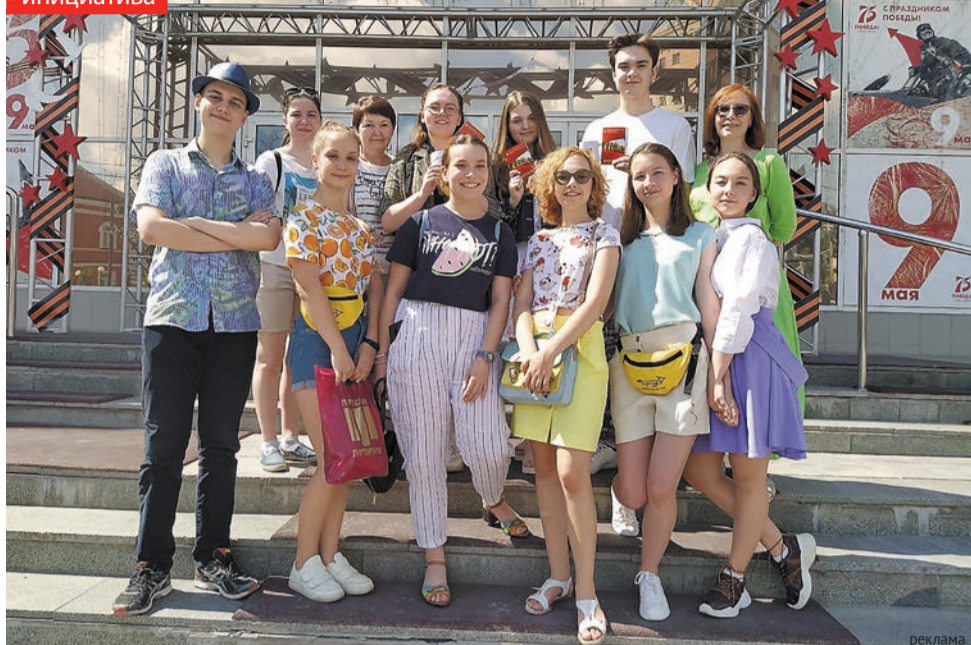
Студия «Прозус-Д» готова к новым проектам

ведущие большинства праздников и торжественных церемоний на сцене ДДЮТ, запустили в Сети акцию «#ПрозусДетям». Ребята прочитали стихи современных детских авторов и пофантазировали на их темы — так получились настоящие мини-спектакли. А в рамках акции «#ПоДорогеВоДворец» ребята записали для своих сверстников любопытные видеорассказы об интересных местах Перми, которые мы часто не замечаем в ежедневной суете. Так стартовал