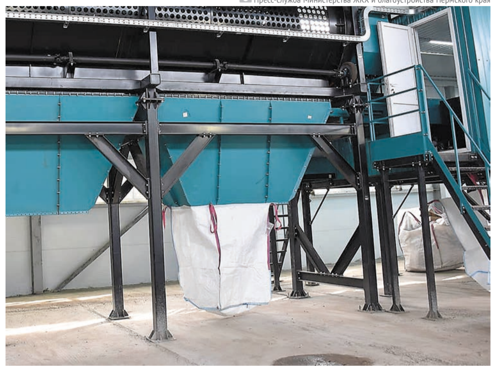
Пресс-служба Министерства ЖКХ и благоустройства Пермского края

Сейчас на территории Пермского края работают три линии сортировки отходов: на действующих полигонах в Березниках и Крас-