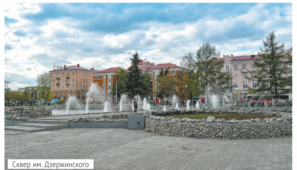
Сквер им. Дзержинского