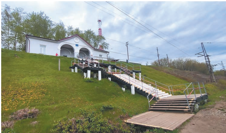
На Гайве в сжатые сроки оборудовали платформу и открыли станцию Кабельную

Городские чиновники при этом добавили, что подрядной организации ставится задача приложить все усилия, чтобы максимально сократить сроки производства работ. Однако стоящие в ежедневных пробках пермяки видят, что на закрытой для проезда стороне дороги в смену трудятся порядка четырёх работников фили-