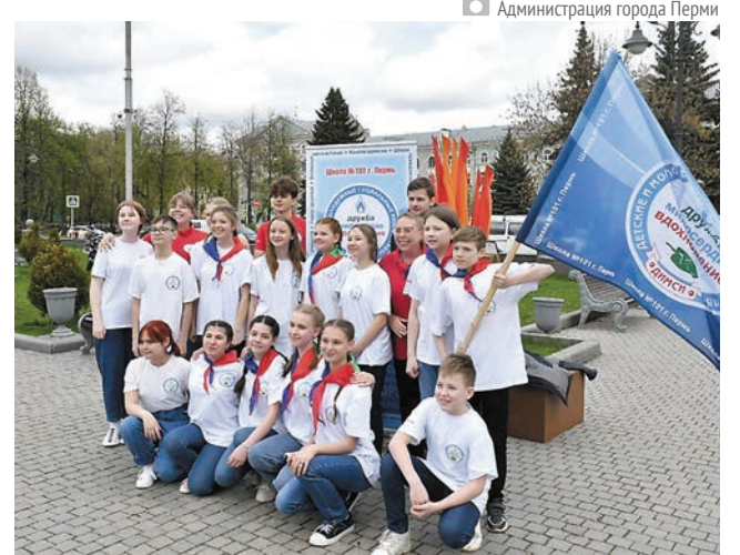
Администрация города Перми

В продолжение традиции пришедшие на церемонию школьники оставили послание своим сверстникам из 2022 года. «Сегодня мы вручаем вам нашу веру в лучшее будущее, свои надежды и стремления. Мы уверены, вы приумножите наши достижения, передав этот опыт своим потомкам, которым суждено увидеть такие вершины развития человеческой цивилизации, о которых вы сами пока мечтаете», — обратились к будущему поколению ребята.