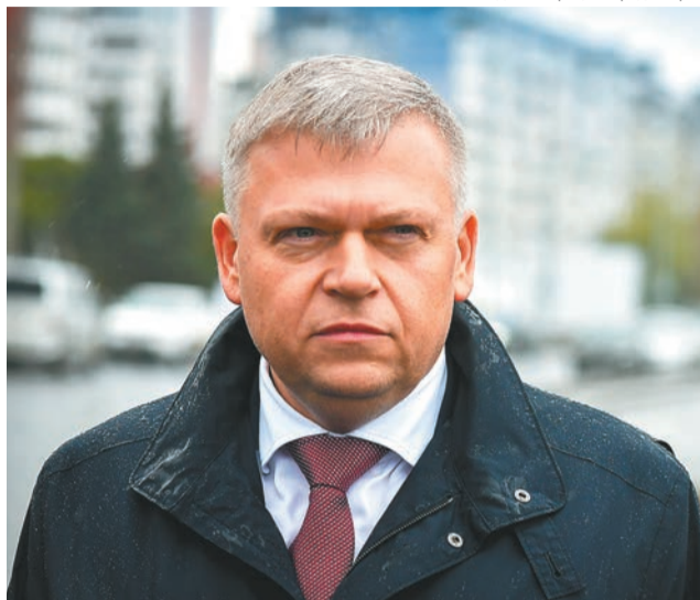
Администрация города Перми

Губернатор Прикамья Дмитрий Махонин ставит