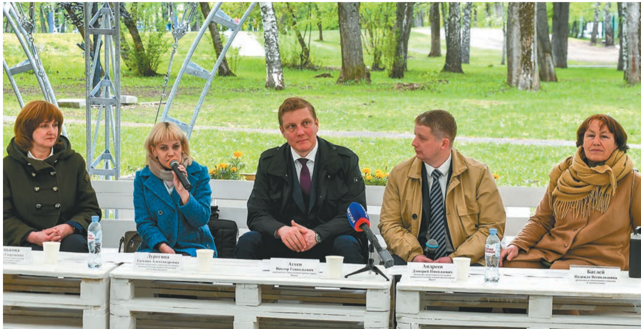
Администрация города Перми

Организаторы презентовали программу фестиваля и проинформировали об участии профессионального экологического сообщества в решении вопросов охраны окружающей среды.