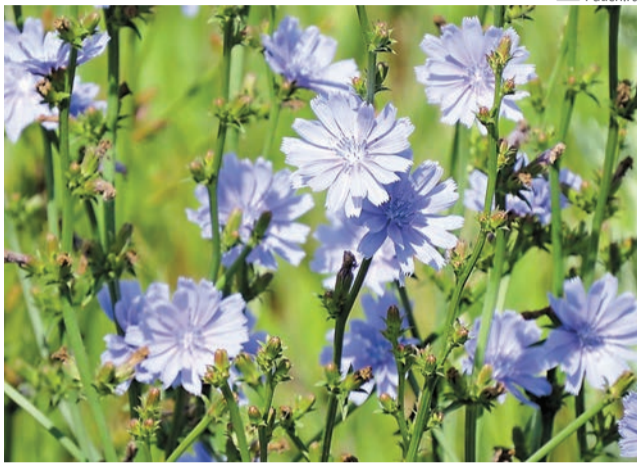
Полезный заменитель кофе — цикорий

Ещё один распространённый сорняк, от которого трудно избавиться при его появлении на участке, — мокрица, или звездчатка средняя. Говорят, что семена этого растения могут храниться в почве до пяти лет, ожидая своего звёздного часа. Мокрицу часто используют для компрессов, её добавляют в салаты, делают настои для приёма внутрь.