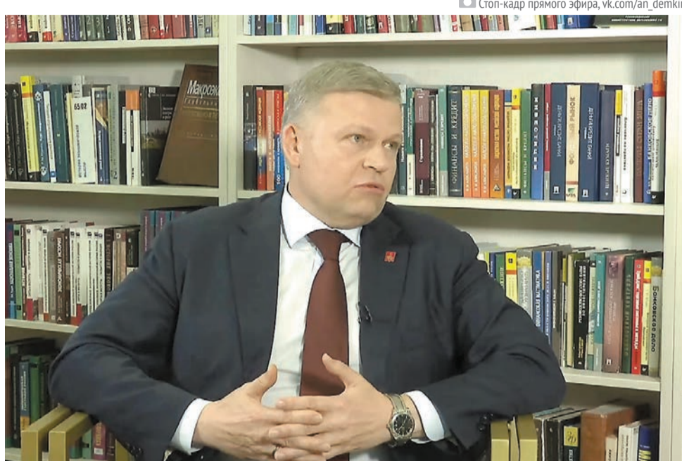
Стоп-кадр прямого эфира, vk.com/an_demkin

«Мы ожидаем увеличения туристического потока в Пермь в следующем году в связи с празднованием юбилея. Нам хотелось бы, чтобы наши гости ощутили не только дружелюбность самих пермяков, но и удобство транспортной инфраструктуры. Благодаря таким оста-