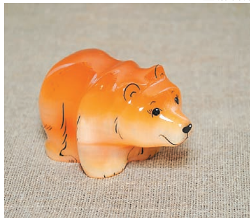
Наибольшую популярность приобрели изделия прикамских камнерезов из селенита

Свою роль в зарождении и развитии промыслов сыграли и географические особенности каждой территории края. Например, где-то было популярным камнерезное искусство, в другой местности — плетение из лыка.