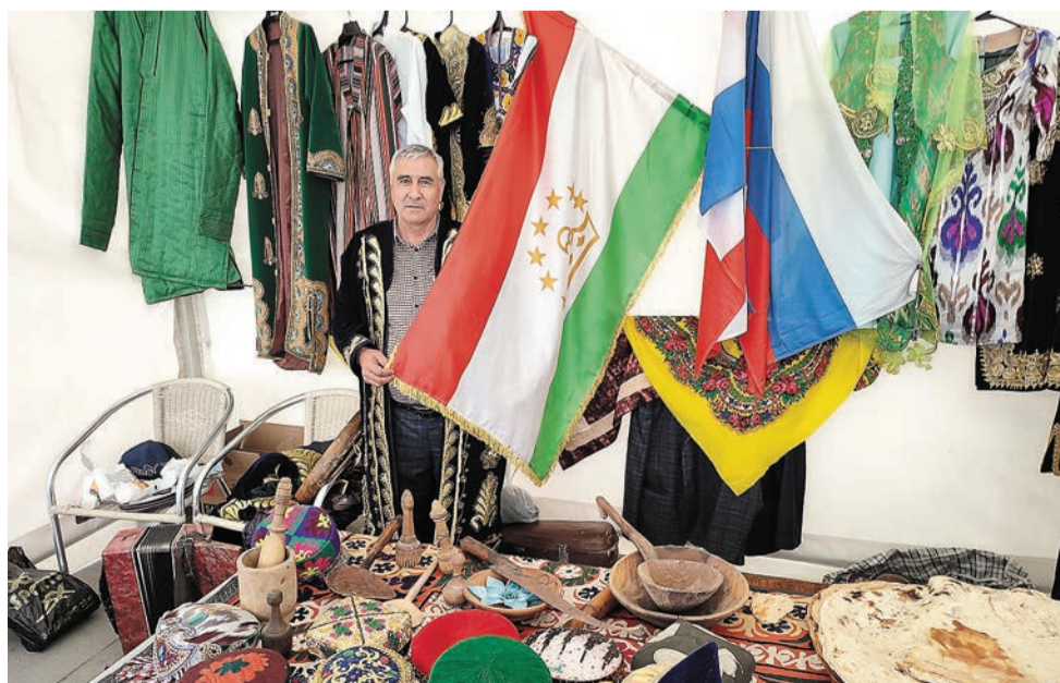
Павильон Союза таджиков Пермского края на Фестивале национальных культур