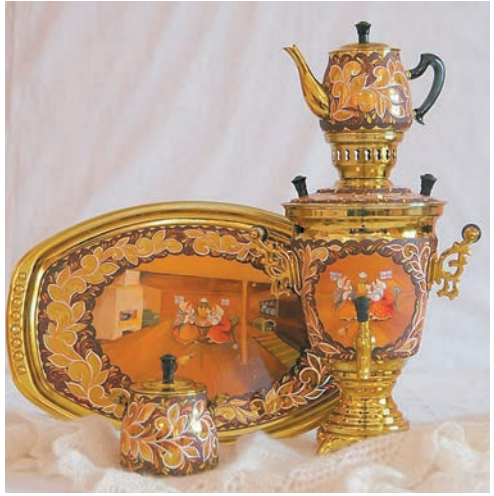
Один из самых известных промыслов Прикамья — самоварное дело

Вышивание тюбетеек до настоящего времени продолжает развиваться в татарских и башкирских деревнях Бардымского округа. Лозоплетение, резьба по дереву, ткачество, вышивка, вязание, изготовление фольклорных кукол — сразу все эти ремёсла представлены в Большесосновском округе Пермского края.