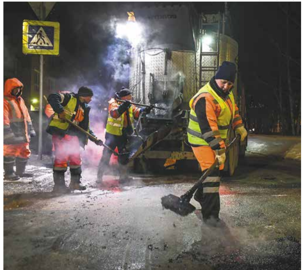
Администрация города Перми

В Орджоникидзевском районе проведены работы на участке ул. Веденева от ул. Кронита до ул. Газонной, где ходит общественный транспорт, соединяющий центральную часть города и микрорайоны. Помимо этого, ямы устранены на улицах