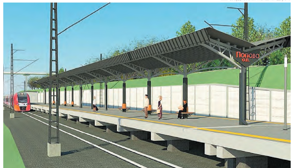
Свердловская железная дорога

Камы. После этого для удобства жителей правобережных микрорайонов Перми СвЖД построила платформы на станциях Кабельной и о. п. Комплекс ППИ, чтобы там смогли останавливаться электрички. Проект также включает строительство ещё четырёх высоких платформ на станциях Пермь I, Лёвшино, Молодёжной и Железнодорожной.