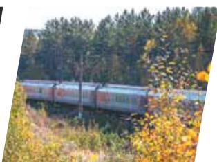
Свердловская железная дорога

В этом году центральный ледовый городок будет посвящён гостеприимству. Ему дали название «Большое пермское чаепитие». По эскизному проекту объект превратится в большой стол с горками-скатертями длиной 1–3 м. В комплекс также войдут монументальные композиции из льда, изображающие чашки и блюда.