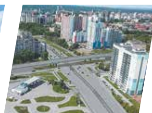
Минтранс Пермского края

За пять месяцев работы экопункта по сбору вторичного сырья, работающего в Индустриальном районе около ТРЦ «Планета», пермяки получили за сданный мусор более 80 тыс. руб. У жителей города приняли картон, бумагу, стекло, алюминиевую тару, плёнки различных видов, пластиковую тару (ПЭТ, ПНД, ПВД).