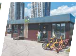
МинЖКХ Пермского края

Перед ноябрьскими праздниками между Пермью и Санкт-Петербургом запустят дополнительные поезда. Их маршрут пройдёт через Глазов, Киров, Вологду, Череповец. Вагоны поездов оборудованы кондиционерами и биотуалетами, в составе есть багажное купе, а также доступна услуга перевозки животных.