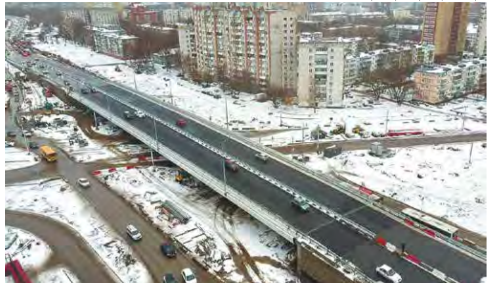
Министерство транспорта Пермского края

Большим событием со знаком плюс в сфере культуры является открытие Краевой музыкальной школы на ул. Энгельса. Она рассчитана на 350 учеников с первого по 11-й класс. Все они приступили к учёбе в начале текущего учебного года.